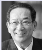
前 三重県知事 早稲田大学大学院教授 北川 正恭氏